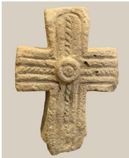
Рис. 1. Каменный крест XI-XII вв. из Змейской (Музей древностей Алании, г. Владикавказ)

В настоящее время крест находится в экспозиции Музея древностей Алании, открытом в Северо-Осетинском государственном университете им. К. Л. Хетагурова (Рис. 1) в 2014 г.