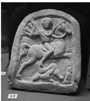
Фракийский Герой-всадник, поражающий чудовищ. Рельеф. Терракота. III в.

В I–III вв. культ Асклепия имел самое широкое распространение во всех Балканских провинциях. Асклепий почитался совместно со своими спутниками, а также с фракийским Героем-всадником ( Ἠήροι , Heroni ), своим богом-отцом Аполлоном и теткой, божественной сестрой-близнецом Аполлона Артемидой (в латинских надписях – Дианой, римской богиней супружеской любви, хранительницей диких животных и покровительницей разумной охоты), нимфами [1].