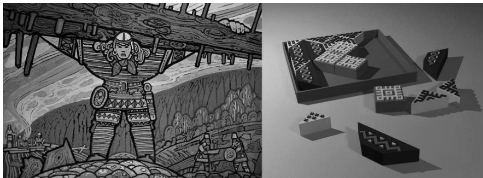
Рис. 2 а, б

Дизайн-проект конструктора основан на известном принципе складывания различных элементов в единую форму, имеющую контур квадрата (Рис. 2б, рук-ль Н. А. Зинченко). Перекладывая многоцветные яркие бруски в заданном пространстве 240x240 мм, можно получить четыре узорные композиции. Красочная гамма орнаментов элементов головоломки базируется на основе использования чистых спектральных цветов, таких, какие характерны для иллюстраций В. Игнатова. А мазки, положенные иллюстратором в форме черточек, своеобразно повторены в деревянных брусках и прямых – мотивах орнамента. Простое, с одной стороны, решение не выглядит таковым за счет причудливого переплетения прямых линий узора коми, разнообразной формы деревянных брусков, общей цветовой насыщенности игровых элементов, а с ними – композиции в целом. Головоломка призвана развивать интеллектуальную и творческую активность детей младшего дошкольного возраста и одновременно является красивым аксессуаром в виде, например, настенного панно, дома в подходящем стиле.