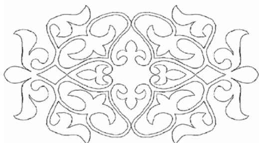
Рис. 1а. Хакасский орнамент, изготовленный методом туюх ўлгү

Растительные хакасские орнаменты в основном предназначались для украшения традиционной одежды. Раньше такие орнаменты вырезались из бересты, которая предварительно обрабатывалась, сейчас ее заменила бумага. Вырезанные орнаменты называются ўлгү 'выкройка, мерка' и бывают двух видов: туюх ўлгү (Рис. 1а) и алынча ўлгү (Рис. 1б). Выкройка туюх ўлгү 'непрерывный узор' (букв.: туюх – глухой, огражденный со всех сторон) предназначается для отделки определённой части костюма путем вырезания полного орнамента (Рис. 1).