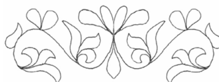
Рис. 1б. Хакасский орнамент, изготовленный методом алынча ўлгү