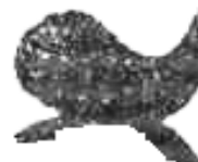
Рис. 6. Пүрек

Характер цветочного узора ай хоозы стал осознаваться хакасскими мастерицами позже, когда появилась возможность им варьировать. Значительную роль сыграли, вероятно, привозные ткани, знакомство с образцами русского народного искусства. Так, на формирование хакасского растительного орнамента наложили отпечаток мотивы и узоры из китайских и монгольских тканей, привозившихся торговцами на территорию Хакасско-Минусинской котловины, которые учитывали запросы и предпочтения местного населения.