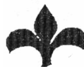
Рис. 3. Иргек