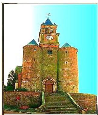
Рис. 3. Церковь святых Курика и Иулитты (eglise Saint-Cyr-et-Saint-Julitte) в Ориньи-ан-Тьераш (Origny-en-Thirache)

Церковь святого Илария (eglise Saint-Hilaire) в деревушке Отреп (Autrepes) находится в 19 километрах к востоку от коммуны Гиз. Здание сложено из кирпича, однако его фундамент и нижний регистр массивных несущих стен выполнен из песчаника. В плане церковь имеет традиционную форму латинского креста. Обращает на себя внимание массивная колокольня-донжон внушительных размеров, к флангам которой примыкают две угловые круглые башни. Четыре этажа этого донжона пронизаны бойницами для ведения фланкирующего огня. Витражи церкви не оригинальны и являются «новоделом», поскольку были выполнены в 1961 г.