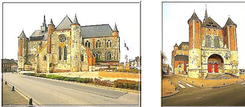
Рис. 1. Укрепленная церковь в Монкорне, регион Тьераш (Thiérache)