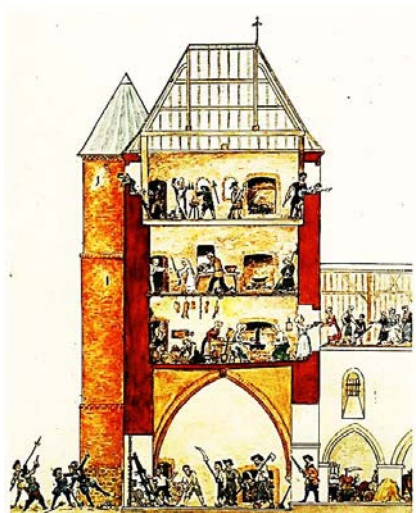
Рис. 5. Церковь Богоматери ( eglise Notre-Dame ) в Вервэн ( Vervins )