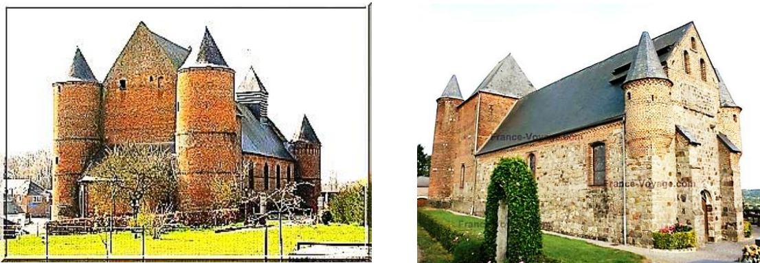
Рис. 4. Церковь святого Мартина ( eglise Saint-Martin ) в Вими ( Wimuy )

Церковь святых Кирика и Иулитты ( eglise Saint-Cyr-et-Saint-Julitte ), расположенная в местечке Ориньи-ан-Тьераш ( Origny-en-Thiérache ), находится в 32 километрах к востоку от коммуны Гиз. Она названа в честь христианских мучеников матери и сына, которые были казнены в начале IV века в годы правления императора Диоклетиана. Здание церкви построено в XII столетии, массивные стены возведены на высоком фундаменте, а к центральному portalу ведет крутая и широкая лестница. От первоначальной постройки сохранился лишь центральный фасад донжона, датируемый XII-XIII веками, а также примыкающие к донжону две мощные круглые башни, возведенные как фортификационные элементы в XVI в. Неф, трансепт и хор здания, а также донжон, разрушившийся в 1918 г. во время проведения реставрационно-строительных работ, были полностью снесены. Позднее они были перестроены заново, поэтому сегодня весьма трудно судить о первоначальном их состоянии. Колокольня донжона в этот же период была украшена декоративным узором из красного кирпича, который имитирует причудливые геометрические мотивы, характерные для вьетнамской архитектуры. Этот исторический нонсенс объясняется тем, что в реконструкции донжона принимал участие епархиальный совет Сайгона в память об уроженце Ориньи – монсеньоре Пиньо де Беэне (1741-1799), который сыграл большую роль в истории Католической Церкви в деле сближения Франции и Вьетнама.