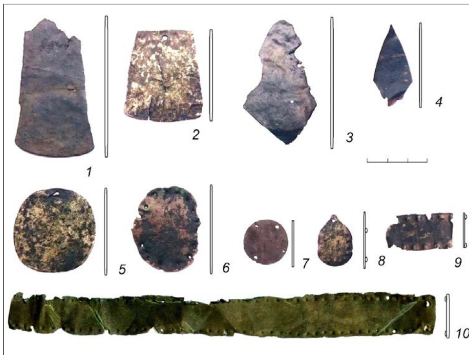
Рисунок 6. Украшения медные: 1-2 – подвески трапецевидные; 3 – подвеска «утиная лапка»; 4 – подвеска ромбовидная; 5 – подвеска круглая; 6, 8 – подвески овальные; 7, 9 – накладки-нашивки; 10 – очелье. 1-10 – святилище «Пламя Сибири»

Подвески трапецевидные плоские из листовой меди, с полукруглой нижней частью. Первая посеребрена с одной стороны, имеет чернение – с другой и отверстие в верхней части для подвешивания (Рис. 6, № 2). Вторая имеет чернение с обеих сторон, верхняя часть, где располагалось приспособление для крепления, утрачена (Рис. 6, № 1).