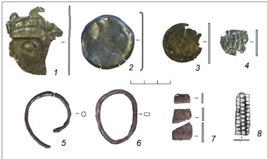
Рисунок 1. Украшения серебряные: 1 – личина; 2-4 – подвески; 5 – серьга; 6 – височное кольцо; 7-8 – накладки-нашивки. 1-5, 7-8 – серебро; 6 – посеребренная бронза. 1-3 – городище «Пламя Сибири 7»; 4, 6 – гор. Антоново 1; 5, 7-8 – городище «Пламя Сибири 6»

из самых распространённых защитных амулетов. Серебро обладает обеззараживающим свойством, что также имело большое значение в сакрализации этого металла.