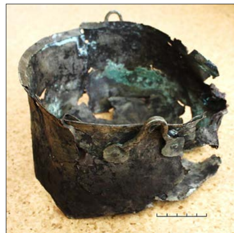
Рисунок 3. Котёл медный. Городище Андреевское 4

В качестве украшений из листовой меди можно выделить подвески-бляхи (Рис. 4, 5), круглую и овальные подвески (Рис. 6, № 5-7), трапециевидные подвески (Рис. 6, № 1-2), подвеску «утиная лапка» (Рис. 6, № 3, 8),