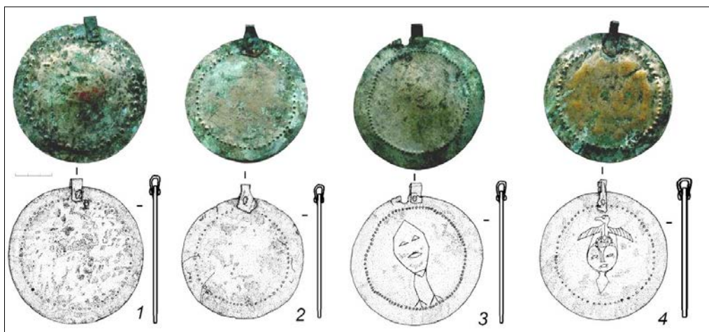
Рисунок 4. Бляхи медные. Городище Андреевское 4

ромбовидную подвеску (Рис. 6, № 4); накладку прямоугольную (Рис. 6, № 9); очелье прямоугольное (Рис. 6, № 10). Рассмотрим их более подробно.