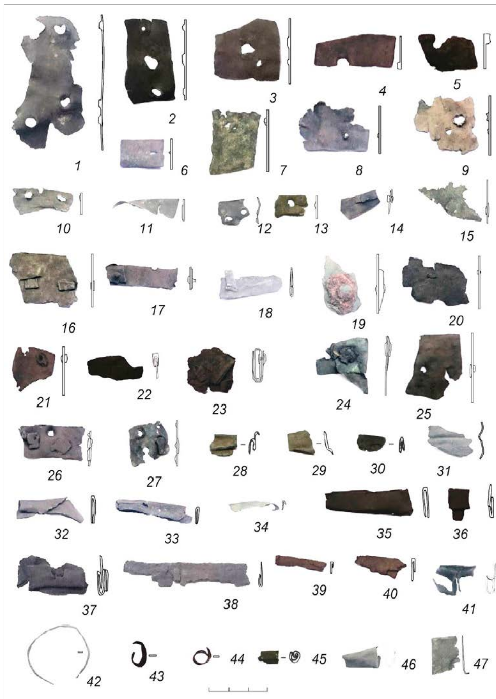
Рисунок 8. Изделия медные: 1-13 – пластинки с отверстиями; 14-27 – заклёпки; 28-47 – обкладки. 1-47 – медь. 1-12, 14-27, 31-44, 46-47 – святилище «Пламя Сибири»; 13, 28-30, 45 – городище Дуванское 28

В это же время появляется обкладка днищ деревянных (?) сосудов (Рис. 7, № 4), круглых и конусовидных предметов (Рис. 8, № 42-46), вещей других форм (Рис. 8, № 28-41, 47). Вошли в обиход медные заклёпки (Рис. 8, № 14-27), которые применялись для ремонта медных котлов, а также для скрепления других предметов. Стали применяться предметы из листовой меди, фрагменты которых представлены пластинками с отверстиями и без них (Рис. 7, № 7-34; Рис. 8, № 1-13).