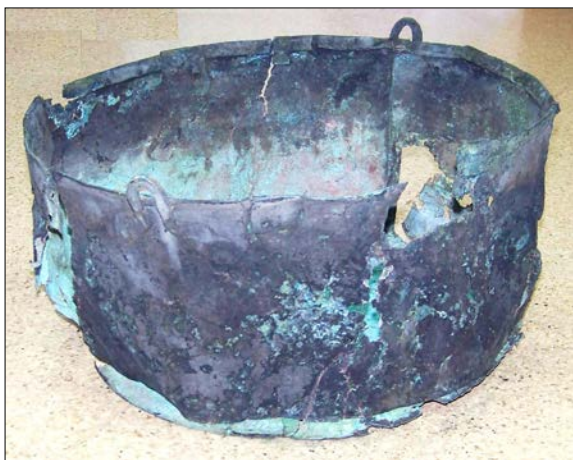
Рисунок 2. Котёл медный. Святилище «Пламя Сибири»

С XII в. в культурах Зауралья получают распространение медные котлы из листовой меди. Например, можно отметить два почти целых котла из листовой меди (Рис. 2, 3), собранные трёхчастной сборкой фальцем и в «зубец», венчики загнуты и отогнуты, ушки с двойной расковкой концов. Внутри многочисленные медные «заплатки» (следы ремонта). По классификации К. А. Руденко они относятся к типу М-4 болгарских котлов, широко распространённых в Приуралье и Зауралье, «датируются XII – началом XIII, встречаются и в XIV в.» [13, с. 32]. Также обнаружены два ушка от подобных котлов, часть скрепления листов котла с зубцом, возможно, деталями котлов являются некоторые медные пластинки.