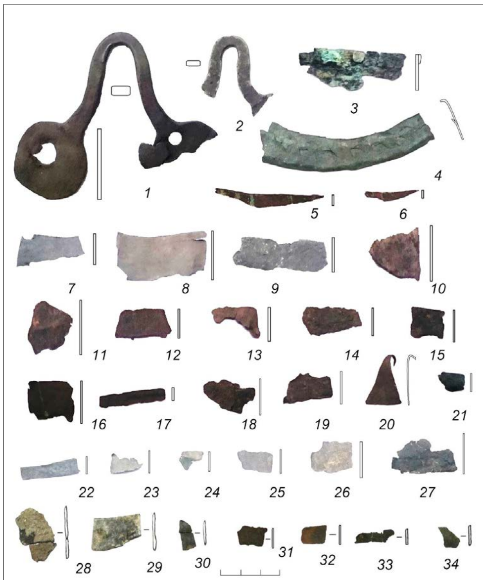
Рисунок 7. Изделия медные: 1-2 – ушки котлов; 3 – фрагмент места скрепления листов котла; 4 – обкладка дна сосуда; 5-34 – пластинки плоские. 1-27 – медь. 1-27 – святилище «Пламя Сибири»; 28-34 – городище Дуванское 28

пробиты насквозь, образуя отверстия для крепления (Рис. 6, № 6). Подвеска овальная плоская из листовой меди, посеребрена с двух сторон, по кромке расположен «пуансонный» орнамент, верхняя часть удлинена для отверстия для привешивания (Рис. 6, № 7).