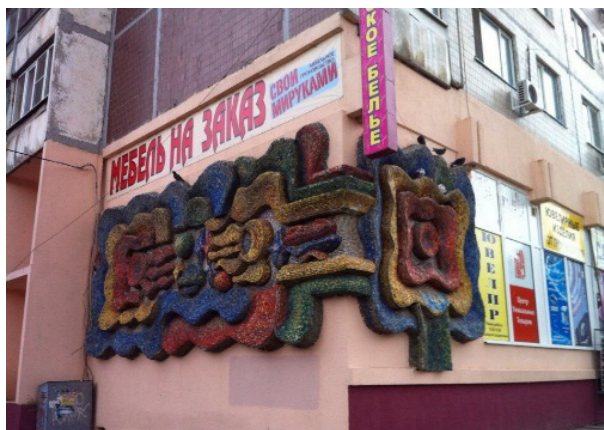
Рисунок 1. «Древо жизни». Мозаичная композиция. Художники С. С. Скопцов, А. И. Шагинов

Многообразие вариантов мозаичных вставок представляет одно из позднейших зданий советского модернизма в Ростове-на-Дону – бассейн «Бриз» (1991-1992 гг., художник Ф. Б. Фарит). В основном это абстрактно-образные композиции, раскрывающие ассоциативный ряд, связанный с морской стихией (Рис. 2).