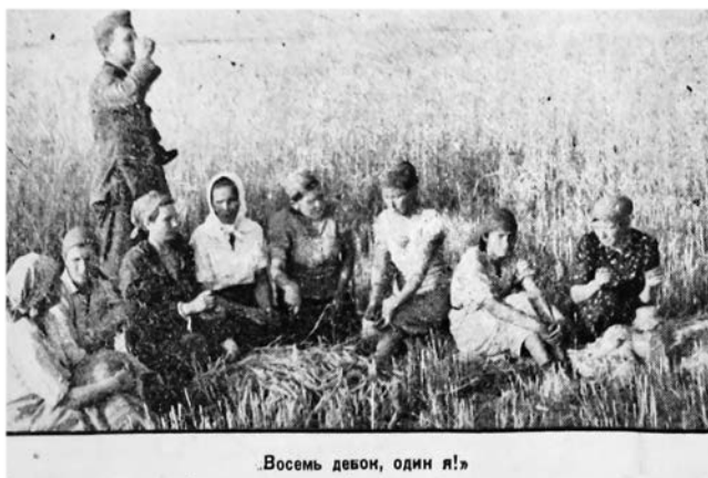
На фотографии немецкий солдат в окружении советских колхозниц. Снимок из немецко-фашистской газеты «Правда» от 4 сентября 1941 г. [6, д. 133, л. 10]

Более лояльной была и религиозная политика немцев в западных районах Ленинградской области по сравнению с другими оккупированными территориями Советского Союза. Здесь командование армией группы «Север» разрешило деятельность Псковской православной духовной миссии. В июле 1941 г. было открыто 5 православных храмов, где регулярно проводились церковные службы.