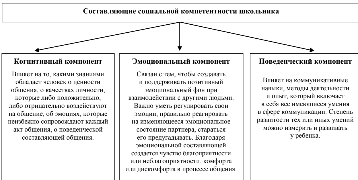
Рисунок 2. Компоненты социальной компетентности школьника

Принципы организации содержания воспитания и социализации применительно к образовательной системе перечислены в Таблице 1.