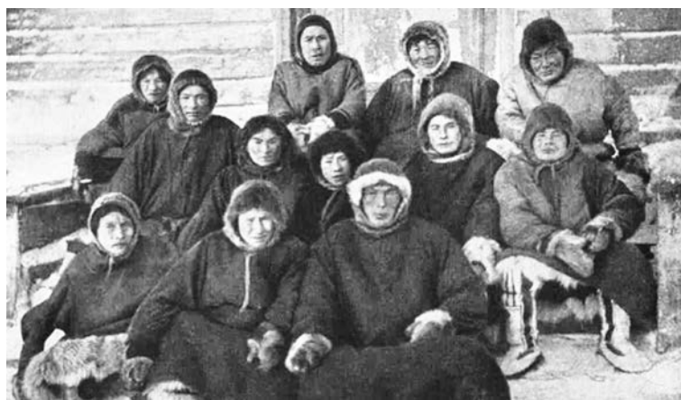
Рисунок 3. Каменные самоеды, начало XX в. [4]

В начале XX в. на Ямале перед охотой было окуривание охотников, отправлявшихся на промысел [5, с. 229].