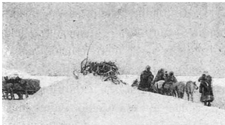
Рисунок 1. Жертвенное место самоедов, начало XX в. [5, с. 225]

В первую очередь это касалось религиозных верований и обрядов. В частности, у остяков существовал целый обрядовый комплекс, представлявший собой моление о благополучном промысле – «пари». Ритуал его проведения был различен в зависимости от целей и значения. Так, перед выходом на рыболовство (в период ледохода) приносили жертву покровителю воды Инк-Ики: набитое сеном чучело из шкуры теленка или овцы опускали под лед, после следовало гадание в ведре воды. В другом варианте совершали жертвоприношение в честь богини Чарас-Най 1 : для хорошего улова и убыли воды поджигали плот с шестом с привязанными приношениями и пускали его по течению. Свои отдельные обряды проводились также для удачи на охоте, в собирательстве и т.д. (Рис. 1) [4, с. 49-50].