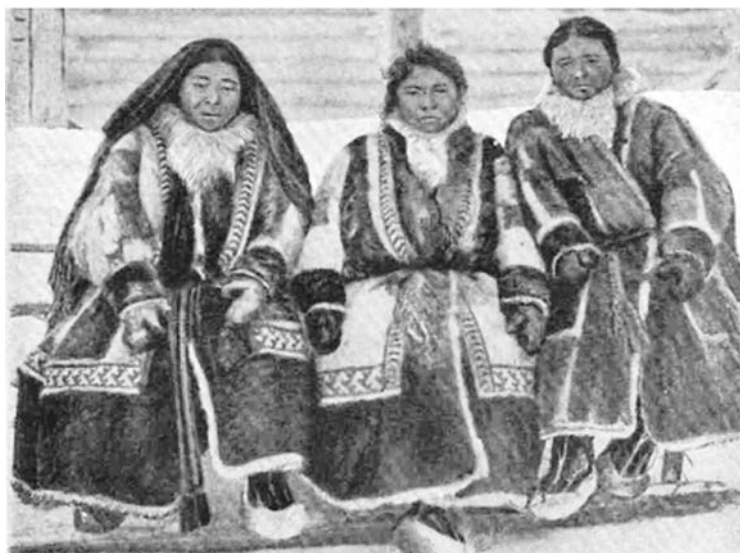
Рисунок 2. Низовые самоеды, конец XIX в. [4]

Остяки и самоеды часто отдавали в дар богам лучшие из добытых ими шкурок. Некоторое время инородцы украшали шкурками и кожами ценных зверей деревья в лесных массивах. Однако со временем такие бесхозные дары богам стали пропадать – их забирали проезжавшие мимо казаки и другие представители пришедшего населения. Тогда автохтоны начали изготавливать деревянные чурбаны (небольшие бревна и прочие изделия), украшать их и хранить в тайниках. Среди богов в отношении промыслов наиболее почитался Ортик. Дары ему были столь значительными, что в период неудачной охоты инородцы даже брали у бога «взаймы» меха для уплаты ясака, которые ранее сами же и подносили [9].