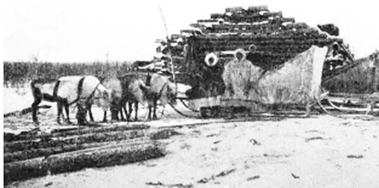
Рисунок 5. Зимняя бревенчатая юрта самоедов [4]

Сам выбор святых мест также производили во многом благодаря промыслам. Так, для освящения какого-либо места требовалось, чтобы на протяжении нескольких лет охота здесь была удачной. В отличие от личных (единичных), публичные (массовые) жертвоприношения совершались гораздо реже. Как правило, их проводили из-за «всенародных бедствий»: неприятных для инородцев государственных нововведений, приезда чиновника, а также по итогам общеплеменной охоты. В этом случае инициатором являлся шаман, манипулировавший умами соплеменников и пользовавшийся их легковерностью. Он склонял сородичей на внушительное жертвоприношение, собирая к передвижному капищу (юрте) богатых оленеводов со своими стадами и остальных инородцев (Рис. 4, 5, 6). Для совершения обряда разводили большой костер, около которого происходило камлание шамана. После соблюдения всех правил шаман подавал знак, и жертвенных оленей расстреливали из луков, добывая копьями. Участники поедали мясо, пили кровь и окропляли ею деревянных идолов. В завершение праздника кожи животных развешивали на деревьях, окружавших капища [3, с. 106-109].