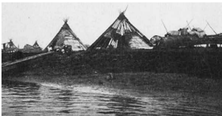
Рисунок 6. Летний самоедский берестяной чум [4]

Сакральное значение автохтоны вкладывали и в орудия промыслов. Например, самые «удачливые» стрелы вонзали в дерево с помощью лука. Этим обрядом выказывалось уважение и почитание богов, обитавших в данной местности. Иногда деревья после плодотворной рыбалки заворачивали «счастливым» неводом. При чем ветхость орудия лова для инородца служила свидетельством его былых заслуг и эффективности.