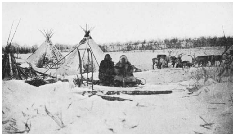
Рисунок 4. Зимний самоедский чум из оленьих шкур [4]

Сам выбор святых мест также производили во многом благодаря промыслам. Так, для освящения какого-либо места требовалось, чтобы на протяжении нескольких лет охота здесь была удачной. В отличие от личных (единичных), публичные (массовые) жертвоприношения совершались гораздо реже. Как правило, их проводили из-за «всенародных бедствий»: неприятных для инородцев государственных нововведений, приезда чиновника, а также по итогам общеплеменной охоты. В этом случае инициатором являлся шаман, манипулировавший умами соплеменников и пользовавшийся их легковерностью. Он склонял сородичей на внушительное жертвоприношение, собирая к передвижному капищу (юрте) богатых оленеводов со своими стадами и остальных инородцев (Рис. 4, 5, 6). Для совершения обряда разводили большой костер, около которого происходило камлание шамана. После соблюдения всех правил шаман подавал знак, и жертвенных оленей расстреливали из луков, добывая копьями. Участники поедали мясо, пили кровь и окропляли ею деревянных идолов. В завершение праздника кожи животных развешивали на деревьях, окружавших капища [3, с. 106-109].