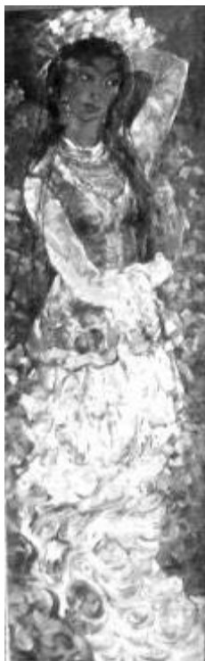
Рисунок 1. И. С. Хайрулинов. Катунь . Холст, масло. 178 x 56 см

в ранних произведениях Хайрулинова. Всё здесь подчинено выражению эмоционального переживания художника, его духовному настроению. Такой образ-настроение присущ многим произведениям И. С. Хайрулинова, и не только пейзажам. Тип живописно-образного претворения действительности в дальнейшем разовьётся в творчестве художника до целых тем.