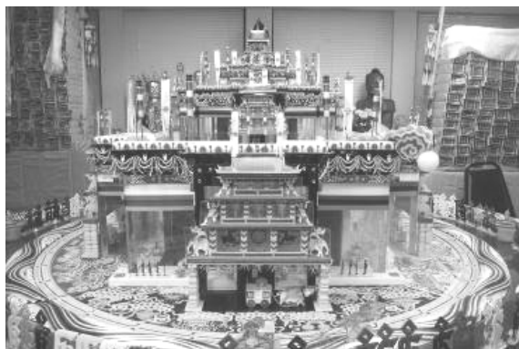
Рисунок 2. Макет мандалы Калачакры

Архитектура, в свою очередь, тоже является результатом творческой деятельности. В. Уайт писал: «...архитектура как устойчивая форма творческой деятельности обладает способностью художественной реализации жизненного содержания. Она существует и развивается как система взаимосвязанных между собой видов деятельности, многообразие которых обусловлено многогранностью самого реального мира, отражаемого в процессе художественного творчества» [19, р. 154]. Архитектура обладает специфическим арсеналом изобразительно-выразительных средств и приемов, выражаемых через существующие в пространстве материальные конструкции и предметы, удовлетворяющие практические и духовные нужды людей.