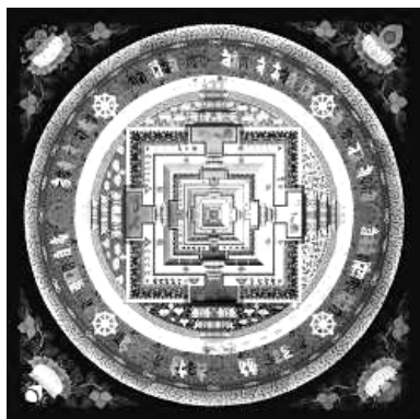
Рисунок 1. Мандала Калачакры

Бурятский ученый М. Н. Хангалов писал, что у монголов представление о начале мира отражено в их мифах, где говорится, что люди, животные и растения возникли в результате творческой деятельности. Например, в одном монгольском мифе начало мира описывается так: «Три Бога, Шибэгэн, Майдар и Эсэгэ, посыпали красной, черной почвой и песком на воду. В результате этого образовалась земля, и на ней росли зелени, деревья. Затем боги создали человека, причем тело из красной земли, кости из камней, а кровь из воды. Они сотворили женщину и мужчину» [15, с. 131].