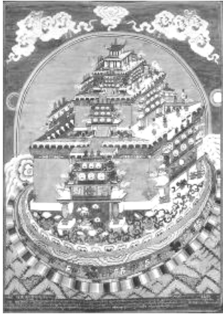
Рисунок 3. Танка с изображением мандалы Калачакры