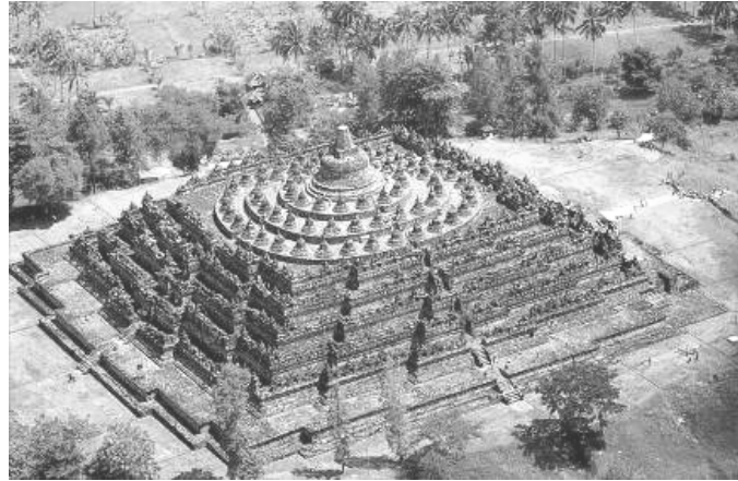
Рисунок 4. Храм Боробудур. Остров Ява, Индонезия