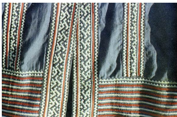
Иллюстрация 4. Элемент орнамента на одежде – «рога оленя». Восточные ханты. Ханты-Мансийский автономный округ – Югра [3, с. 34]