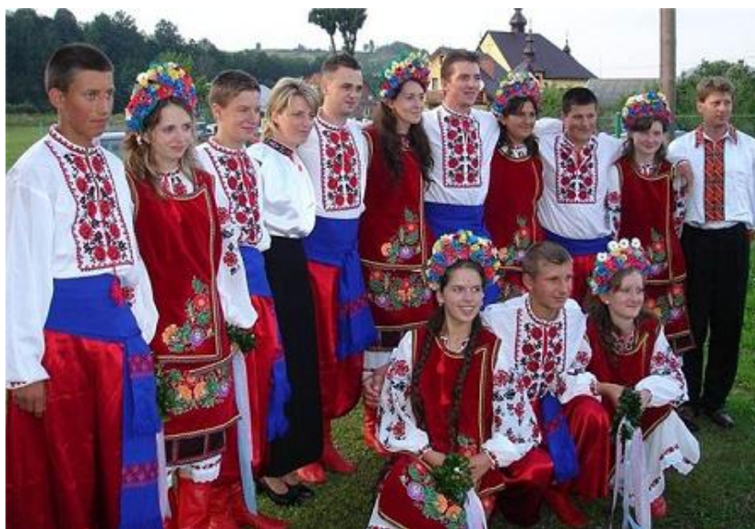
Иллюстрация 2. Русины (Сербия) [6]

Присутствие розы в качестве одного из базовых элементов русинского орнамента подчеркивает его связь с украинской, русской и в целом славянскими культурами. Однако, в отличие от русских и украинских растительных орнаментов, в которые роза включается, но не является обязательной, в орнаментах русинов этот стал устойчивым, повторяющимся, граничащим с обязательным. Если орнамент растительный, а не геометрический, то роза там повторяется независимо от цветовой гаммы костюма (в качестве сравнения – Илл. 1, Илл. 2). Подобное явление в иных славянских культурах проявляется не так ярко: там растительные орнаменты включают более многочисленные изображения, поэтому данный элемент может быть классифицирован как характерный признак декоративно-прикладного искусства именно русинов.