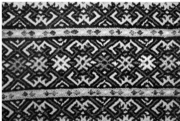
Иллюстрация 3. Гуцульский орнамент. Вышивка на одежде [6, с. 98]