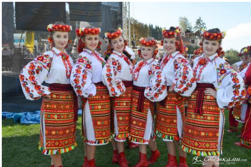
Иллюстрация 1. Русины в национальной одежде (Прикарпатье) [10]

Присутствие розы в качестве одного из базовых элементов русинского орнамента подчеркивает его связь с украинской, русской и в целом славянскими культурами. Однако, в отличие от русских и украинских растительных орнаментов, в которые роза включается, но не является обязательной, в орнаментах русинов этот стал устойчивым, повторяющимся, граничащим с обязательным. Если орнамент растительный, а не геометрический, то роза там повторяется независимо от цветовой гаммы костюма (в качестве сравнения – Илл. 1, Илл. 2). Подобное явление в иных славянских культурах проявляется не так ярко: там растительные орнаменты включают более многочисленные изображения, поэтому данный элемент может быть классифицирован как характерный признак декоративно-прикладного искусства именно русинов.