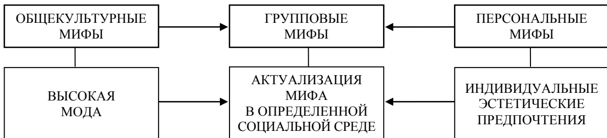
Рисунок 4. Механизм актуализации мифа

Схема взаимодействия общекультурных и персональных мифов, появление на их основе групповых могут быть прослежены в любой период жизни человека. Рождение: давая ребенку имя, мы обращаемся к общекультурному значению, восходящему к древнегреческому языку, и вкладываем в этот выбор свои личные ожидания от ребенка, от тех многочисленных жизненных выборов, которые он совершит. Взросление, социализация: приобщаясь к социальным нормам, человек пытается соединить, к примеру, свои индивидуальные эстетические предпочтения и те идеалы, которые предлагает общество; это «примирение» происходит в условиях определенной социальной среды. Смерть: общество в соответствии с традициями, законами и волей умершего прощается с ним, подводит некие итоги жизни. Таким образом, общекультурные и персональные мифы выступают как некая теория, сформированная на базе практических наблюдений, а групповые мифы – практика, где актуализируются или, напротив, развенчиваются общекультурные и персональные мифы (см. Рис. 4).