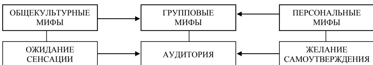
Рисунок 5. Развитие мифа в сети Интернет

Весьма плодотворной почвой для современных мифов стала сеть Интернет (см. Рис. 5). И если раньше общество еще могло регулировать мифотворчество и существовала некая элита, профессионально этим занимающаяся, то теперь персональные мифы, с легкостью проходя цензуру коллективных мифов, могут напрямую становиться источником общекультурных. Любой человек сегодня, желая быть в центре сенсации и получить от этого экономическую выгоду, готов предложить какие угодно факты своей биографии или спровоцировать новые. Персональные мифы выходят на первый план: как мы смогли убедить всех в своей правоте, как мы заставили всех собой любоваться.