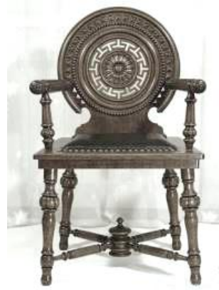
Рисунок 4. Кресло по проекту И. П. Ропета. Государственный исторический музей

Легко заметить, что в данном случае образным и композиционным «камертоном» произведения, определяющим его силуэт и выражающим принадлежность к русскому стилю, является солярный символ. Вместе с тем данный мотив органично вплетается в весьма традиционную, характерную для европейской мебели периода барокко структуру стула с конструктивными элементами, выполненными в виде точеных балясин. Идея круглой спинки также неоднократно использовалась в решении стульев и кресел (особенно в эпоху рококо и классицизма). Общеизвестны массивные кресла с круглыми спинками времен Наполеона. Такое подчинение образа форме характерно для более раннего, романтического этапа поисков национального стиля, но продолжает применяться и в период историзма. Сопоставление формы локотников, ножек и спинок, украшенных солярным символом в окружении меандра, экспоната из Таганрогского музея и кресла, выполненного по проекту И. П. Ропета (Рис. 4), позволяет определить исследуемое произведение как предмет мебели, изготовленный по эскизу этого архитектора.