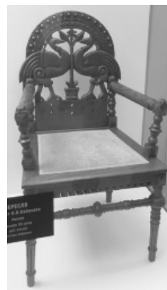
Рисунок 2. Кресло по проекту Н. В. Набокова. Частное собрание

Ростовский областной музей изобразительных искусств