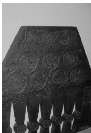
Рисунок 7. Фрагмент кресла. Таганрогский государственный литературный и историко-архитектурный музей-заповедник

Абсолютно аналогичное кресло (Рис. 8) имеется в ульяновском Государственном историко-мемориальном музее-заповеднике «Родина В. И. Ленина» [9]. Это кресло в неорусском стиле, происходящее из набора мебели, изготовленного в 1910-1911 годах по проекту архитектора Ф. О. Ливчака для интерьера Дворянского земельного и крестьянского поземельного банков г. Симбирска (дерево, дерматин; резьба, точение).