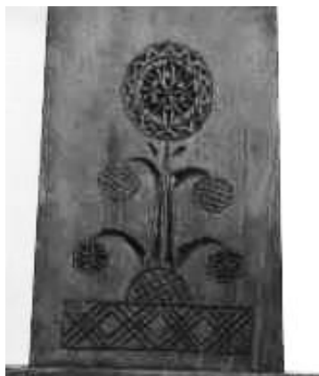
Рисунок 5. Фрагмент кресла. Таганрогский государственный литературный и историко-архитектурный музей-заповедник

Декор всех названных предметов восходит к абрамцевским работам Е. Д. Поленовой, уделявшей, как известно, особое внимание геометрической трехгранно-выемчатой резьбе. В частности, декор царги кресла находит аналог в украшении подобной детали скамьи (2 пол. 1880-х гг., дуб, резьба, тонировка) из Всероссийского музея декоративно-прикладного и народного искусства [Там же, с. 41]. Основной мотив – древоцветок (Рис. 5) – почти дословно воспроизводит орнаментацию известного шкафчика (Рис. 6) этого же автора (конец 1880-х – начало 1890-х гг., сосна, резьба, раскраска, тонировка) из Музея народного искусства им. С. Т. Морозова [Там же, с. 42].