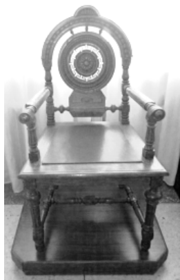
Рисунок 3. Кресло. Новочеркасский музей истории донского казачества

Второй предмет – кресло (Рис. 3), близкий аналог которого из Музея истории Санкт-Петербурга, датируемый 1870-1880-ми годами, воспроизведен в книге Н. Г. Прохорова [6, с. 17]. Локотники, прямые ножки, проножки, вертикальные стойки спинки выполнены в виде точеных балясин. Задние ножки сплошные. Сидение трапециевидное, полужесткое. Силуэт спинки формирует полукольцо с рельефным декором «катушки с бусами», по центру усложненное выступом с орнаментом «полу-солнце». Ниже находится круглый диск, связанный с полукольцом при помощи трех шаровидных элементов. Диск включает розетку в центре, окруженную ажурным кольцом с меандром и внешним глухим кольцом с резными «бусами». Под диском размещен поддерживающий его шестиугольник, соединенный с вертикальными стойками.