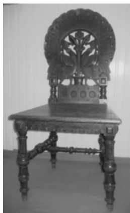
Рисунок 1. Стул.

Ножки и проножки стула, относящегося к типу стульев с «подсадными ножками», решены в виде сочетания точеных цилиндрических форм, шаров, сплюснутых шаров и колец, а также кубического элемента (в месте крепления средней проножки). Опущенная передняя царга имеет орнаментированный сдержанным геометрическим декором нижний край, фланкированный квадратными выступами. Сиденье щитовое, жесткое, накладное. Спинка овальная, оформлена при помощи ажурной и плоско-рельефной резьбы. Основным мотив может быть трактован как изображение двух птиц в геральдической композиции по сторонам древа жизни. Последнее не без юмора представлено в виде цветка, произрастающего из горшка. Хвосты птиц, объединяясь, образуют веноч, слегка расширенный в центре и формирующий внешнюю окружность спинки. Сами птицы могут быть определены и как петухи, и как павлины.