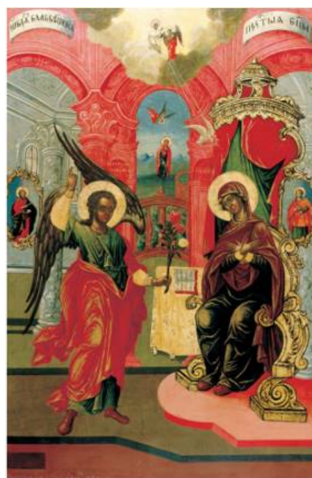
Иллюстрация 4. Икона «Благовещенье». XVIII в. Иркутский областной художественный музей [11]

Проведенное исследование высветило несколько аспектов истории миссионерства Русской православной церкви. Во-первых, использование буддистских мастерских для написания православных икон представляется весьма вероятным и логичным, учитывая веротерпимость обеих религий. Во-вторых, подчеркивается близость духовных ценностей буддизма и христианства (что в целом является дискуссионным вопросом в науке, т.к. буддизм, в отличие от ислама, не относится к авраамическим религиям). В-третьих, в Сибири идея Единого Бога приобрела новый смысл и причудливые формы местной этнической среды. В комплексе эти факторы создали предпосылку для формирования не только мультикультурных, но и мультирелигиозных явлений в местном социуме, которые до настоящего времени обеспечивают мирное сосуществование всех народов, имеющих там этногенетические корни.