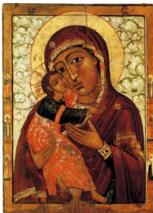
Иллюстрация 3. Икона «Дева Мария». XVII в. Иркутский областной художественный музей [11]