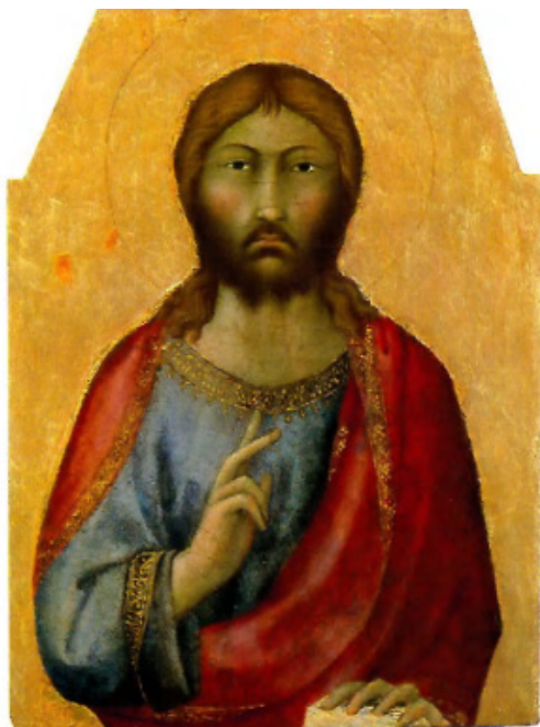
Иллюстрация 1. Икона «Иисус Благословляющий». Худ. С. Мартини. I пол. XIV в. Пинакотека Ватикана. Зал 2, инв. № 40160