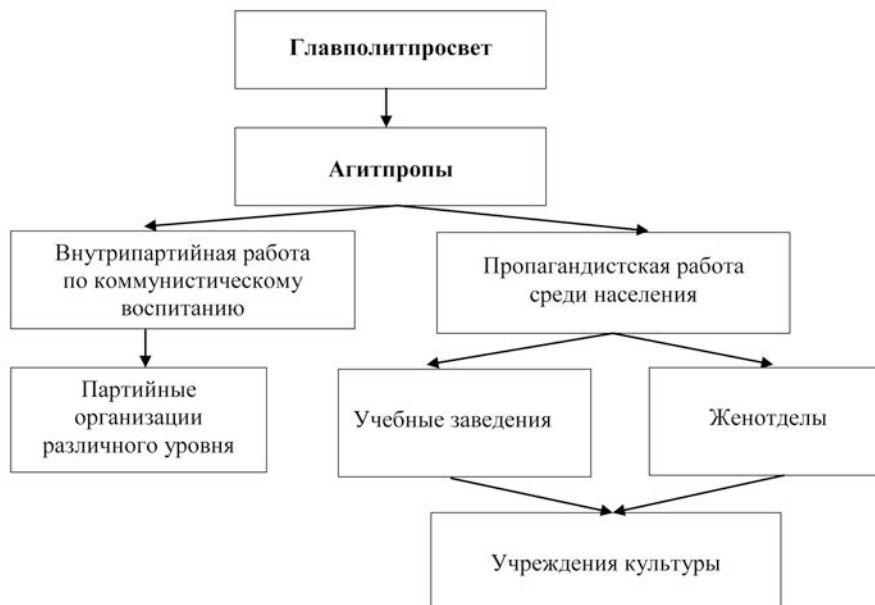
Рисунок 1. Механизм агитационно-пропагандистской работы