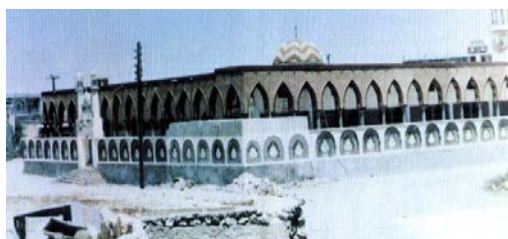
Иллюстрация 3. Суннитская мечеть султана Аль-Альма (1764, г. Бандар-Ленге)