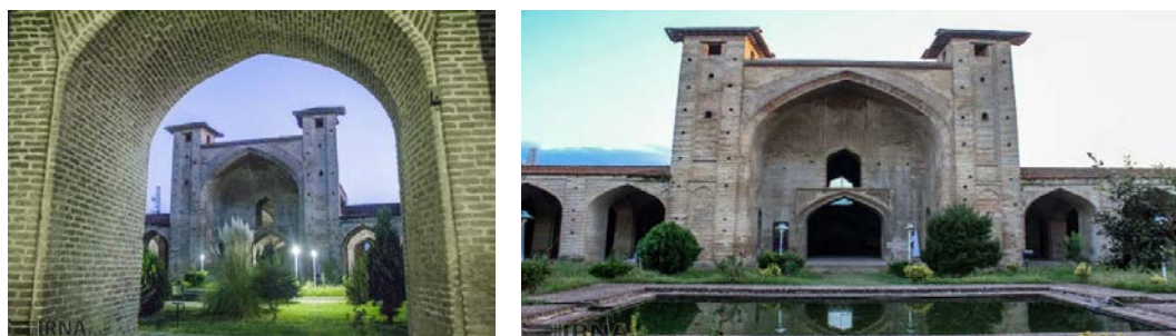
Иллюстрация 4. Шиитская Мечеть Фарахабадское Сарай (1616, г. Сары)