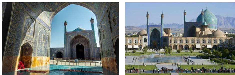
Иллюстрация 5. Шиитская мечеть Имама (1642, г. Исфахан)

Центральный двор как сердце мечети устанавливает визуальный баланс внутри мечети. Если человек находится на одной из осей двора, он замечает портал молельного зала, и его отражение на поверхности водяного зеркала водоема создает новое изображение, которое является вертикальным и усиливающим заданный верующему вектор движения. Как уже отмечалось, в суннитских мечетях вместо широкого бассейна во дворе присутствует фонтан для омовений, лишенный отражающей поверхности большой площади.