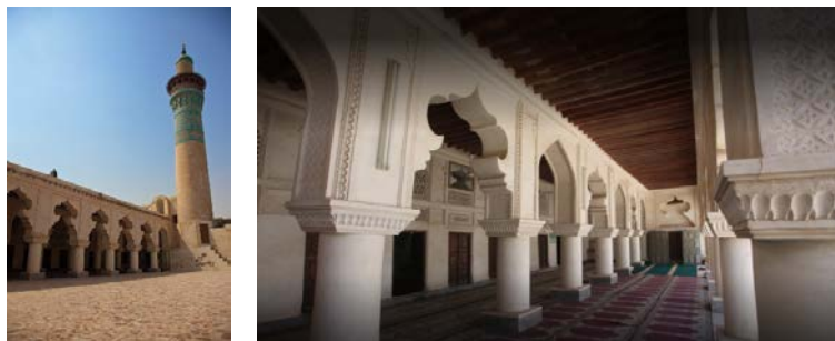
Иллюстрация 1. Суннитская мечеть Ибн Аббаса (1859, г. Бандар-Ленге)