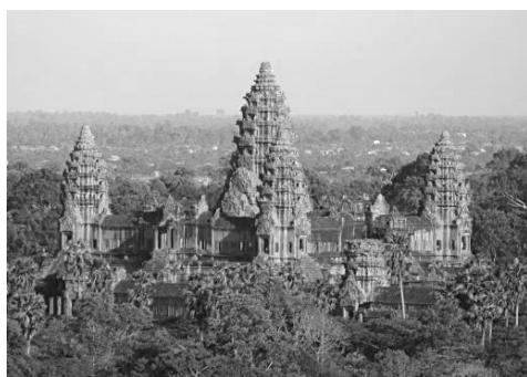
Рисунок 3. Ангкор Ват. Храм Вишну. Камбоджа

Колонны античности явились настолько универсальным декором в оформлении архитектурных сооружений, что их использовали зодчие на протяжении многих веков. Сегодня ордерная система Древней Греции является символом культуры эллинов и охотно используется современными дизайнерами.