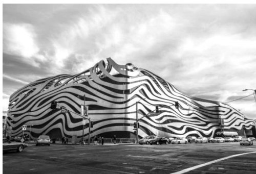
Рисунок 6. Музей автомобилей Петерсена в Лос-Анджелесе

Декоративное решение фасада актуально и сегодня. Стиль “Stream wave” – наглядное тому подтверждение. Здесь соединяются воедино эмоционально-чувственная сторона и идейно-символическая. Возникновение стиля стало возможным благодаря ряду решений, применяемых в современной архитектуре: во-первых, новым материалам для строительства, таким как солевые плиты, изопласт, алюминий, биопластик, кевлар и т.п.; во-вторых, новым технологиям: ТИСЭ, BIM, 3D-панелям, Велоксу, бетону из углекислого газа и т.д.; в-третьих, компьютерным программам: 3D, PRO100, Planner 5D, SketchUp, Астрон Дизайн и ряду других. Благодаря всему этому становится возможным создавать и проектировать фантастические здания, делая их, с одной стороны, совершенно естественными, с другой – возводя в ранг произведений пластических искусств. Ценность художественного качества такой архитектуры заключается не только в её нетрадиционном решении, но и в функциональности, комфорте, эстетической привлекательности. Декоративность фасадов такой архитектуры может доминировать над самой конструкцией и формой зданий, становясь ведущим элементом, выражающим художественную ценность всего объекта. Так обычные постройки можно превратить в произведения художественного творчества благодаря декору, поэтому современные архитекторы активно применяют его элементы не только как часть оформления фасадов, но и делают его главным элементом дизайна здания.