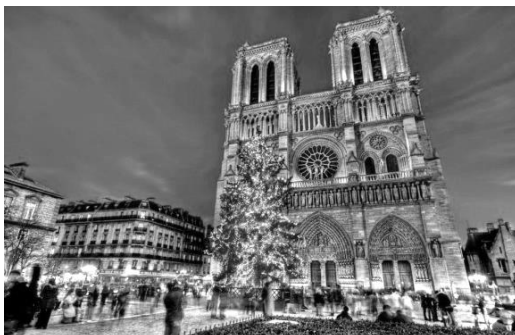
Рисунок 5. Собор Парижской Богоматери. Готика. Франция

декор архитектуры остается популярным по сей день. Как отмечает Е. А. Афонина: «Будущее формируется, новые здания постепенно достраиваются, но фундаментом навсегда останется прошлое, в частности готическая архитектура» [2, с. 142].