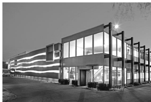
Рисунок 10. Нуйен Л. Штаб-квартира (Rockpanel). Рурмонд. Нидерланды. 2018 г.

По словам авторов книги «Курс монументально-декоративной композиции в профессиональной подготовке архитектора» Г. И. Панксенова и И. Л. Левина: «Каждая эпоха диктует свои принципы формирования целостного архитектурно-пластического окружения» [8, с. 74]. Сегодня воплощения этих принципов сильно зависят от строительных материалов и технологий. Так, в нидерландском городе Рурмонд из панелей Rockpanel сделан фасад Штаб-квартиры (Рисунок 10). Материал, из которого они выполнены, – экологичный, пожаробезопасный, долговечный. Так характеризуется базальтовая плита. Она способна принимать какую угодно форму, так как, по описанию её создателя архитектора Люка Нуйена, при нагревании и расплавлении базальт превращается в волокна каменной ваты. Он так описывает процесс обработки материала: «...жидкое вещество буквально пролетает над вращающимися валами и застывает, образуя каменные нити. В многослойном фасаде офиса Rockpanel я попытался отразить символизм производственного процесса» [4].