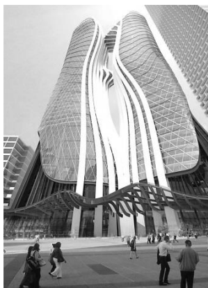
Рисунок 7. Рахмани Э. Площадь Парраматта – ступени 5 и 6 башен. Австралия. 2013 г.

сделало его необычным и неповторимым экземпляром, в котором стиль “Stream wave” показал себя во всей красе (Рисунок 6). Плавные ленты, выполненные из алюминия, «обволакивают» прямоугольное здание, практически не касаясь его стен. Пространство между самим объектом и этими лентами сделано не случайно. В ночное время внутри между ними включается подсветка, и кажется, что архитектурное сооружение движется. Алюминиевые ленты напоминают корпус автомобиля. А красный цвет стен здания, на фоне которого располагаются серебряного цвета волнообразные линии конструкции, придаёт эффект 3D. Иллюзорно, красиво, волшебным передаётся суть сооружения, впечатляя своим фасадом, тем самым привлекая зрителей к себе. И, конечно, хочется войти внутрь, чтобы соприкоснуться с чем-то необычным и уникальным. Линии стиля, выполняя декоративную функцию, создают образ автомобиля, украшая своими красивыми изгибами. Они придают динамику архитектурному творению, создавая впечатление движения. Кажется, что это живой организм. Данный фасад выражает ценность своего содержания, передавая то, что все живет, меняется, движется. Поток энергии в виде серебристых волн на красном фоне олицетворяет не только духовную составляющую объекта, но и его материальную сущность, сохраняя в себе лучшие образцы машин прошлых лет, бережно охраняя их идеал красоты и комфорта прошлого времени.