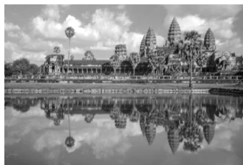
Рисунок 4. Ангкор-Тхом. Камбоджа

В архитектуре храмов в Юго-Восточной Азии, в частности Камбоджи, декор – словно живой растительный ковер из скульптур. Уникальные по красоте храмы Ангкор Ват (Рисунок 3) и Ангкор-Тхом (Рисунок 4) возвышаются над джунглями и кажутся естественным продолжением природного ландшафта. Данные памятники привлекали и привлекают внимание исследователей и ученых как образцы соединения и синтеза искусства и природы. По словам Теч Самнанг: «По размерам, монументальности и скульптурному убранству Ангкор Ват принадлежит к числу самых грандиозных памятников средневекового культурного зодчества» [9, с. 22]. Конструкция сооружений растворяется в декоре и напоминает песочные замки. Такое оформление архитектуры храмов делает их узнаваемыми и является символом веры.