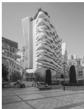
Рисунок 9. Лотта Ж.-П. Жилой комплекс Le Stella в Монако. 2018 г.

Философское понимание водной стихии отражается во многих учениях, и в наше время данный вопрос очень актуален. Он придает глубокий смысл всему сущему и заставляет искусство отражать его суть в произведениях. Наблюдая проявления действия воды, подчеркивая её значимость, а также отражая красоту волн, глади и т.п., человек становится чище и более открытым. Умиротворение от водной глади дает ключ к изменению эмоционально-психологического состояния индивида, настраивая его на совершенство и мудрость в познании бытия.