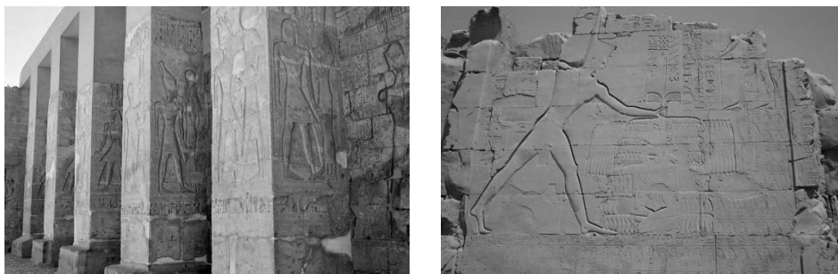
Рисунок 1. Рельефный декор храмов Древнего Египта

Декоративность в архитектуре придает эмоционально-выразительную сторону объектам, организуя в себе синтез пластической формы с конструкцией, что эстетизирует окружающее пространство. Средства, приемы, материалы, технологии при создании декоративности в архитектуре могут быть самыми разнообразными. Их многогранность определяет специфику направлений и стилей. Так, применение валют указывает на античность, окна-розы – на готику, волнообразной линии – на модерн и т.д. Эти элементы организуют ритмику, пластику в архитектуре, делая её звучание ярче, интенсивнее, разнообразнее. Иногда даже декоративные элементы играют главную роль во внешнем облике, определяя его идейное и эмоциональное воздействие. Кроме того, внешние украшения стен зданий создают определенное впечатление и являются главными отличительными элементами того или иного стиля. Но в целом декоративность органично вписывается в архитектурный ансамбль, включающий в себя идею, конструкцию, форму, цвет и фактурность.