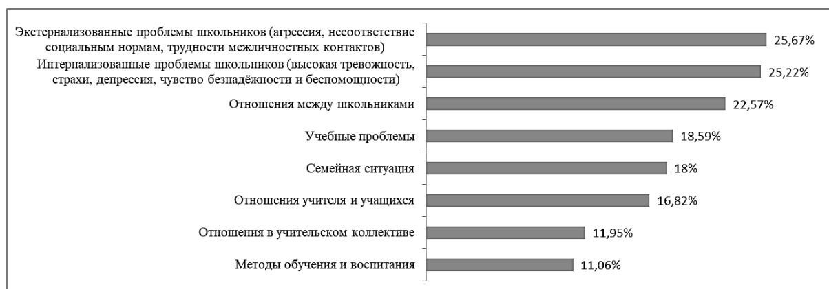
Рисунок 2. Направленность проблем при обращении к педагогу-психологу школы в обычных условиях

По результатам ответов на вопросы второй части опросника (Рисунок 2) можно сказать об изменении категории проблем, встающих перед учителями. На первые места вышли проблемы, связанные с агрессией, несоответствием поведения социальным нормам, трудностями межличностных контактов, т.е. проблемы экстернализации [24], далее – проблемы, связанные с высокой тревожностью школьников, чувством безнадежности и беспомощности, потерей контроля над своим поведением, фрустрацией, т.е. проблемы, направленные на внутренние качества личности.