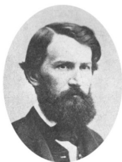
К. Д. Ушинский

комы еще по учебе в университете, а впоследствии много общались и переписывались. После смерти друга Рехневский дал большой очерк «Константин Дмитриевич Ушинский» в «Вестнике Европы» (1870, № 2), в котором осветил некоторые малоизвестные события биографии своего друга.