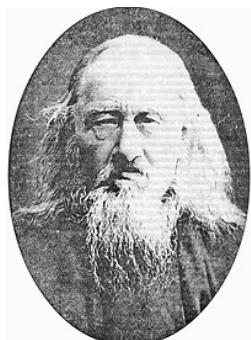
И. С. Беллюстин