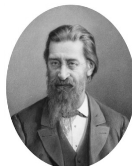
В. Я. Стоюнин