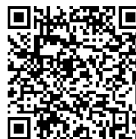
Рисунок 2. Ссылка и QR-код для доступа к онлайн-книге

https://sites.google.com/view/readmore-online-book/home