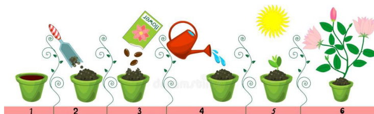
Рисунок 2. Правильный порядок действий при посадке растений

Чтобы перейти к посадке, учащимся необходимо выбрать растение. Для выбора предлагаются растения, которые произрастают в различных климатических условиях и имеют различное время прорастания. Каждый учащийся получает таблицу с неполной информацией о стране произрастания, условиях и продолжительности выращивания различных растений. Детям необходимо собрать полную информацию по всем растениям. Для этого им нужно работать в парах, опросить всех участников и записать недостающую информацию в таблицу. На основе полученной информации каждый выбирает растение для посадки. Дети должны проанализировать собранную информацию и выбрать такое растение, которое можно выращивать в условиях лагеря. Для посадки можно предложить укроп, петрушку, горох, лук-порей, шпинат (dill, parsley, peas, leek, spinach). С помощью данного задания реализуются коммуникативный, познавательный и культурный компоненты CLIL.