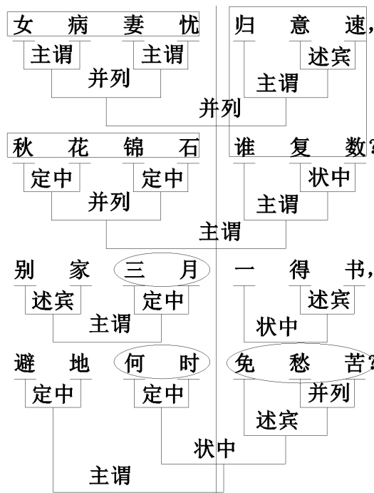
Рисунок 2. Анализ по непосредственным составляющим строк 5-8 стихотворения Ду Фу «Отправляюсь из Ланчжуна»

Прозаический перевод рассматриваемого стихотворения на русский язык представим в Таблице 1.